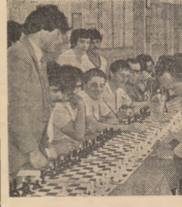
SIMULTAN CU IUBITORII DE

lăudabil că îi descoperim, că îi modelăm. Este de salutat totodată și inițiativa buzoienilor care, între „ferestrele” probelor, au programat un inedit cros ai prichindeilor, cu copii între 4-6 ani, o inițiativă pe care am mai întîlnit-o și la Tg. Mureș, Slatina, Constanța și Baia Mare. Sînt inițiative care se impun atenției, pentru că gustul pentru exercițiul fizic trebuie creat o dată cu formarea deprinderilor de mișcare, în grădinițe, încă din învățămîntul preșcolar.