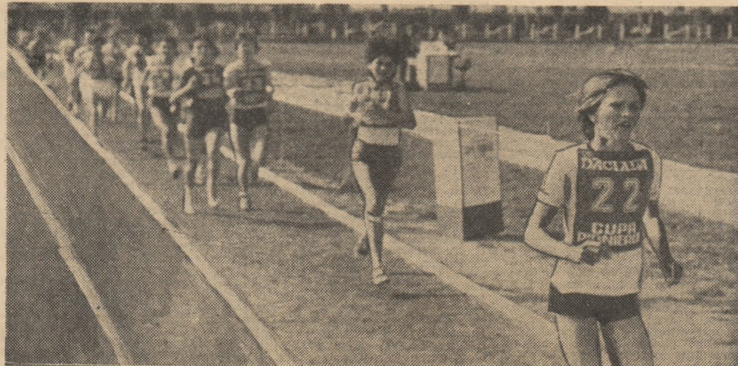
Secvență din proba de cros a pionierilor de la categoria 13-14 ani (1 000 m).