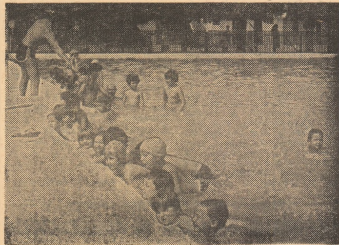
...în plină lecție. Se exersează bătaia apei cu picioarele!