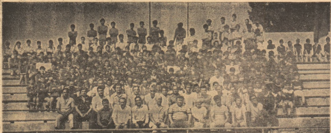
O fotografie tradițională, realizată de Alexandru VENA