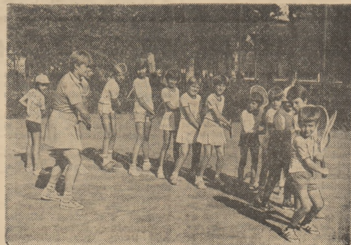
Incepe o nouă lecție de pregătire. Viitorii performeri sînt numai ochi și urechi la antrenarea lor