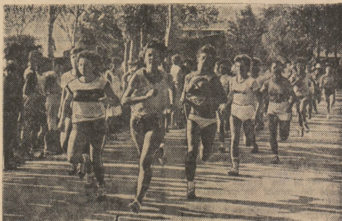
Întrecerile de cros reunesc la start tot mai mulți competitori. Iată o secvență de la aceste mereu frumoase alergări în aer liber organizate în cadrul „Daciadei”