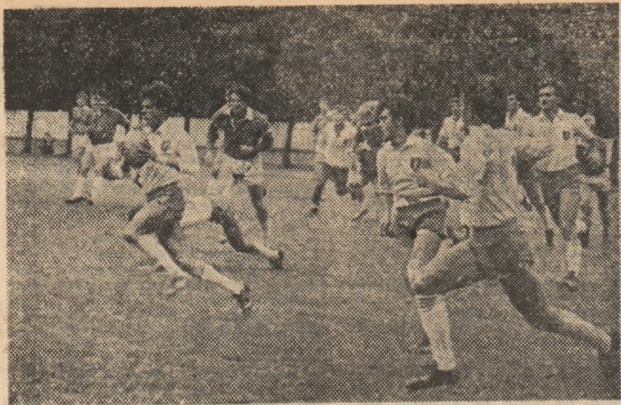
O excelentă șarjă a tricolorilor noștri, care se va încheia cu un nou eseu...

Debut convingător al rugbiștilor noștri în „Turneul Prietenia” (j):