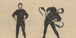
Pi. 4 1-2-3

P. I. — stînd cu brațele întinse sus. Rotarea lor înainte 2 ori și întîndere cu arcularea trunchiului înainte. Rotarea brațelor înapoi de 2 ori și îndoiră cu arcularea trunchiului înapoi. Executat: 6 ori cu inspirație — expirație.