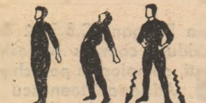
Pi. 1-2 3-4

P. I. — depărtat stînd cu minile la șold. 3 rotații ample și lente ale trunchiului spre stînga și apoi spre dreapta. Executat: de 4 ori.