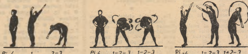
Pi. 4 1 2-3