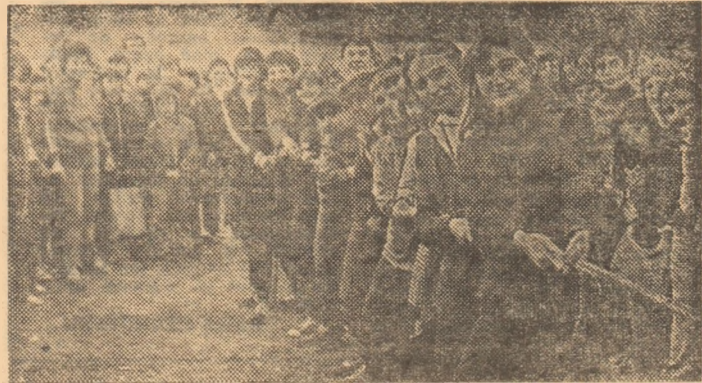
In suta acțiunilor sportiv-recreative organizate cu copiii și tineretul din județul Suceava...