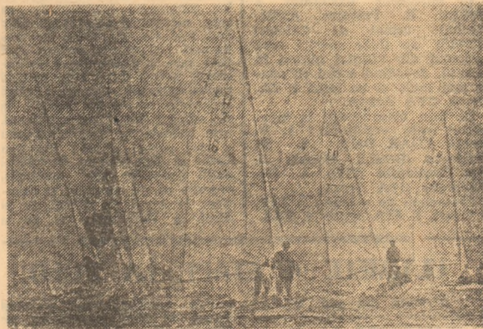
Pe scena necuprinsă a mării, spectacolul întrecerilor de yachting este mereu captivant