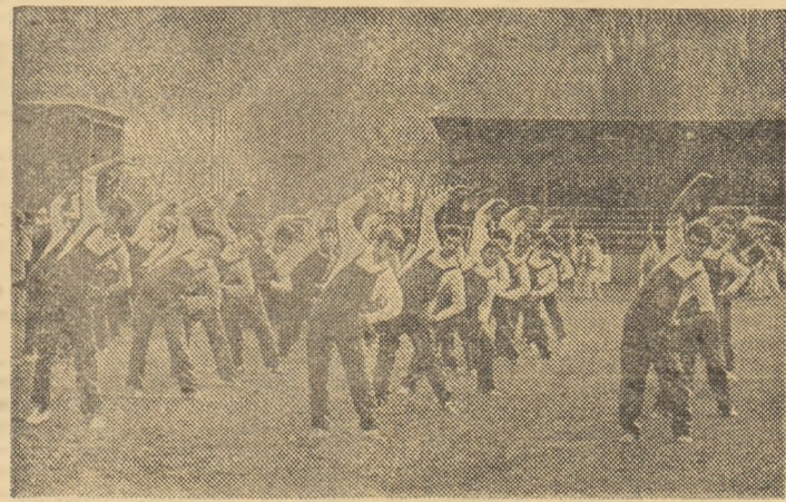
În întreprindere, gimnastică la locul de muncă. Pe stadion, demonstrație în cadrul spectacolului „Rapsodii de toamnă”