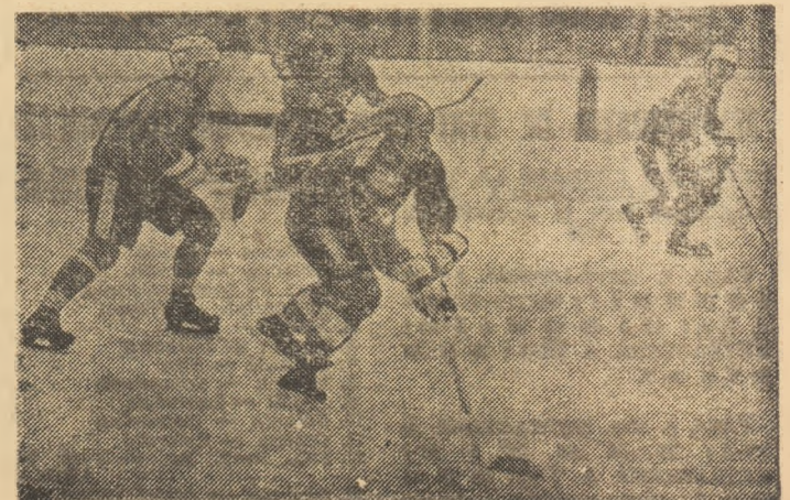
Secvență din derby-ul Steaua-Dinamo