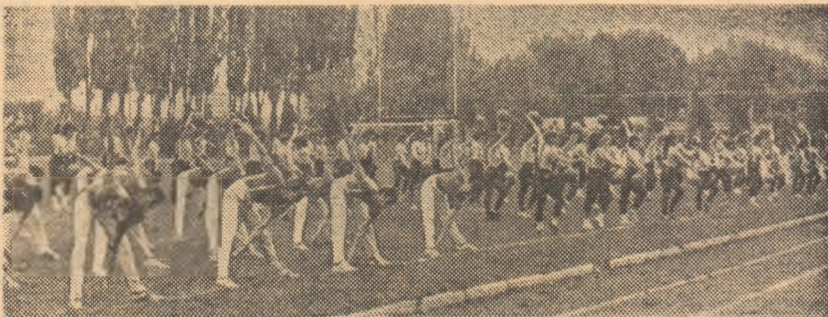
O convingătoare repriză a reprezentanților I.E.F.S.

● Complexul de la „Tei” a trăit duminică un moment cu adevărat sărbătoresc, marcat de entuziaste întreceri în cadrul Anului Internațional al Tineretului