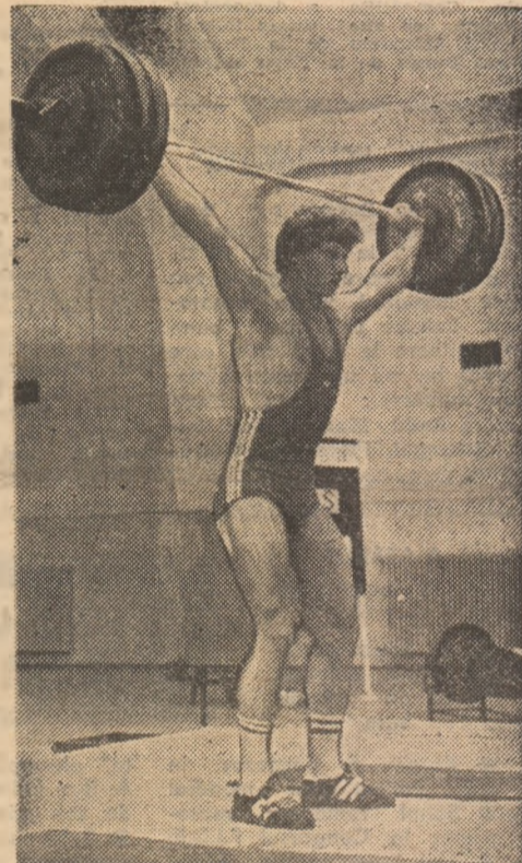
Nicu Vlad — un halterofil model