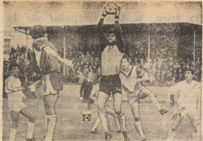
Atacanții de la Victoria ezită și ...prinde Cristin.