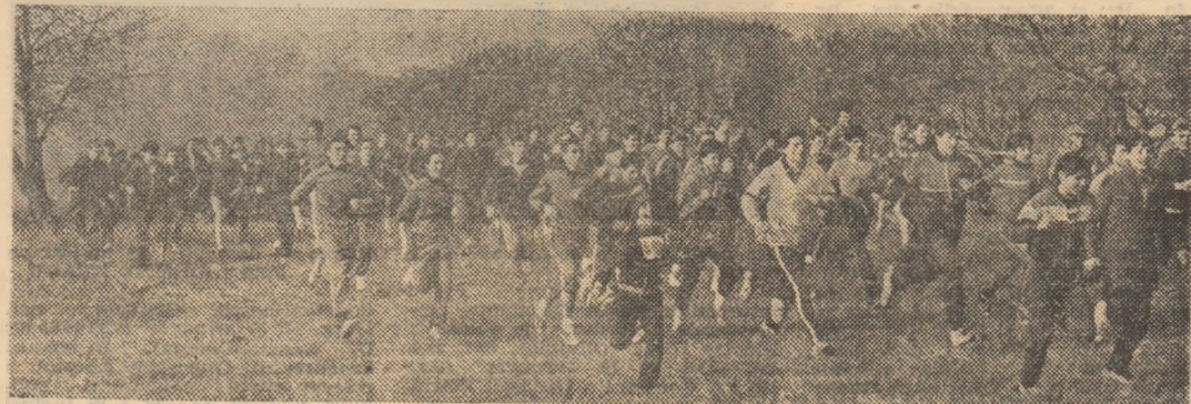
În plină desfășurare, una din cele 10 finale ale crosului dotat cu „Cupa A.I.T.”