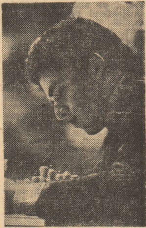
Jul, bravura pe eșichier. Este, intrucitva, antipodul lui Karpov, jucătorul tehnicii prin excelență, al calculului dus pînă în cel mai mic amănunt. „Creativitatea a învins rutina!” — spun unele comentarii, poate puțin exagerate. Oricum, acest nou campion promite să aducă și un suflu proaspăt în avanscena „sportului minții”.

Reprezentativa Uniunii Sovietice a câștigat titlul de campioană europeană de judo pe echipe, la masculin, învingând, în finală, la Bruxelles, selecționata Franței cu 3—2 (2 partide încheiate la egalitate). Punctul decisiv a fost adus echipei sale de către Verițev, care l-a învins, prin ippon, pe del Colombo. Cu aceeași ocazie, s-a desfășurat și prima ediție a Campionatului european feminin pe echipe, pe prima treaptă a podiumului urcînd reprezentativa Franței: 4—3 în finala cu echipa R. F. Germaniei.