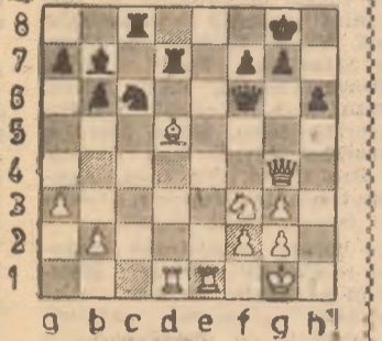
Karpov joacă (greșit) 1...Te8. Cum va răspunde Kasparov?

Am dat în enunț: negrul are cuvîntul! Purtătorul de cuvînt al pieselor negre era tînărul nostru echipier. Și el n-a ezitat să și-l spună cu aplomb, dovedind o clarviziune tactică de-a dreptul impresionantă: 1...Nb3! (o primă bravură, cu amenințare de mat la g2, pionul alb fiind „legat” pe verticală) 2.Ng5 (iese din legătură, alte încercări fiind 2.g3 Dd4! sau 2.f3 T:e3! imediat perdante) 2...Ng2! (a doua surpriză, nebunul negru pătrunde mai departe în dispozitivul advers) 3.R:g2 (fără șansă sînt și 3.Td1 Nf3 sau 3.Nc2 Ne4 4.Td1 Ne6 etc.) 3...Te2!! (iată și a treia poantă, pe care se bazează de fapt întreaga combinație) 4.D:e2 Cf4+ 5.Rf3 C:e2 și negrul a rămas cu material în plus, iar poziția albului este fără apărare. În partidă s-a mai jucat 6.Ne3 Cg1+ 7.Rf4 h5 8.Td1 Ch3+, după care jucătorul iugoslav a depus armele, convîncîndu-se că la 9.Re5 Df6+ 10.Re4