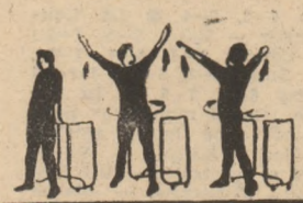
P.I. 1-2 3-4