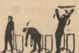
P.I. 1-2 3-4

P.I. — sînd depărtat cu spatele spre mașină (masă) în ușor sprijin pe mîni și șezut. Răsucirea trunchiului cu brațele oblice în lateral sus, cu 2 arcuri (stînga). Aceeași spre dreapta. Se execută: 4 ori.