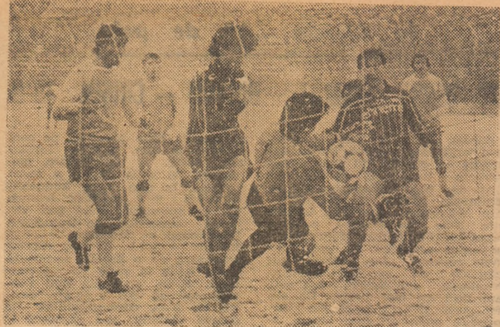
Un nou asalt al rapidiștilor la poarta lui Anghel