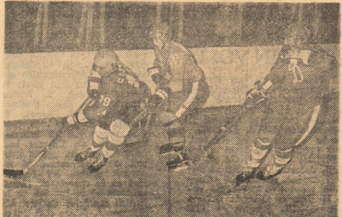
In atac, Costea, ajutat de Solyom, prezență activă unde se creează și se finalizează fazele de gol