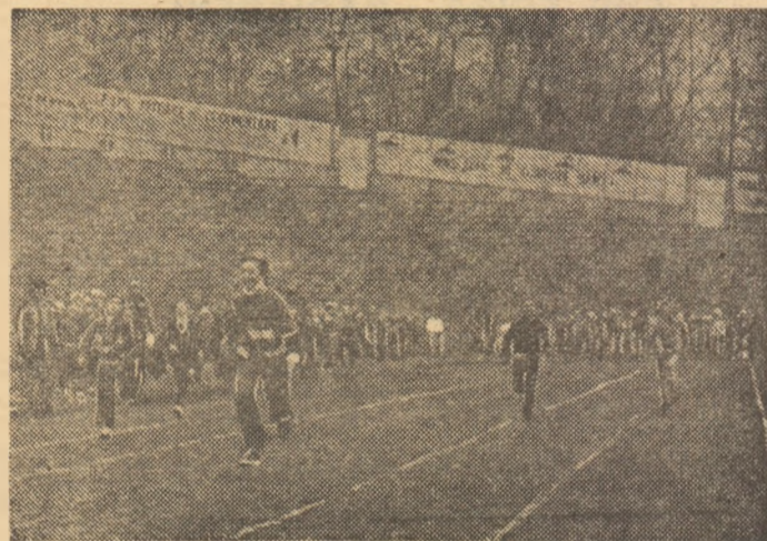
Pe stadionul Dundrea, în căutarea viitorilor atleți