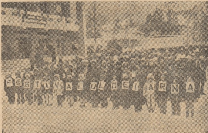
Elevii școlii nr. 4 din Cîmpulung Moldovenesc, înaintea primului concurs de patinaj al acestui an

Concret: Vatra Dornei, Cîmpulung Moldovenesc și Gura Humorului, în principal, au o frumoasă bază materială adecvată sporturilor de iarnă. Începutul l-a realizat cunoscuta stațiune balneo-climaterică Vatra Dornei, prin amenajarea unei pîrtii de schi, pe Dealul Negru, și a unui traseu de sanie în vecinătatea acestuia, amenajări sportive care au constituit punctul de plecare în inițierea și organizarea unor mari acțiuni de masă și chiar de performanță, la nivelul copiilor și juniorilor — festivaluri ale sporturilor de iarnă,