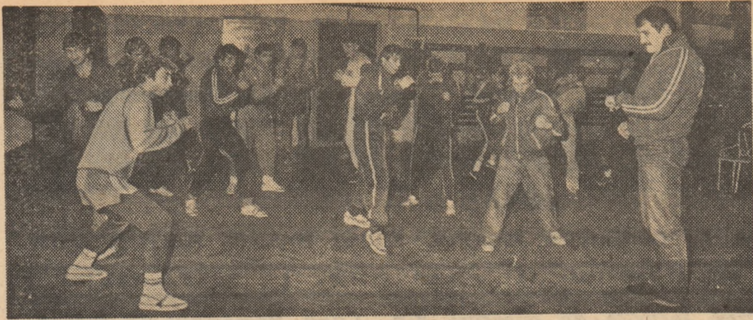
Echipa pugiliștilor de la Dinamo, campioană „en titre”, s-a pregătit asiduu pentru mult așteptata confruntare (decisivă) cu Steaua.