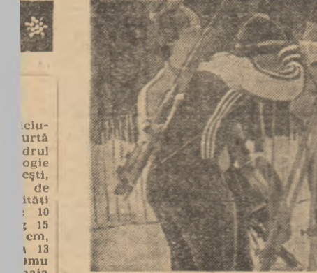
Pe Valea Râșnoavei, zăpada căzută în aceste zile a permis bizoniștilor să se antreneze intens, știut fiind că și de pregătirea în condiții specifice depind rezultatele viitoare. Un punct important în programul de antrenamente îl constituie „poligonul”, raidurile de aici fiind „egale” cu numeroase secunde în plus, și locuri în minus în clasamen- tă, ceea ce... lată-l, deci, pe componenții lotului național verifi- cind, după una din trecerile prin poligon, rezultatele obținute.