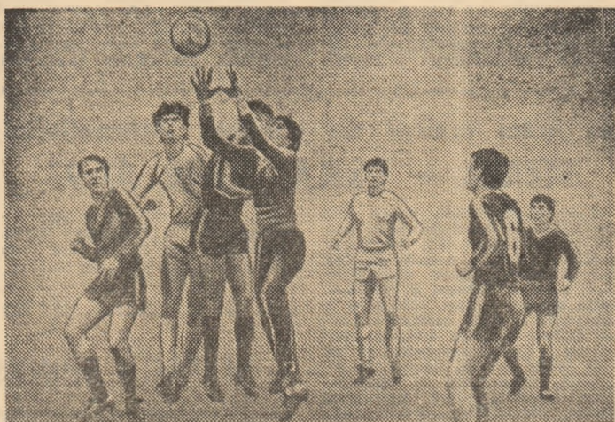
Duel aerian la poarta juniorilor

D. Sava (min. 67), D. Petrescu (min. 76) și Nuță (min. 81). Arbitrul V. Alexandru a condus cu greșeli formațiile: LOTUL DE TINERET : Stângaci (min. 12 Ziotea; min. 46 Stângaci) — Mihali (min. 35 Bănuță), Cirstea (min. 46 Baicea), Mirea, Weisenbacher (min. 46 Topolinschi) — Ursu (min. 46 Sabou), Cristea — care trebuia eliminat în min. 18 pentru fault