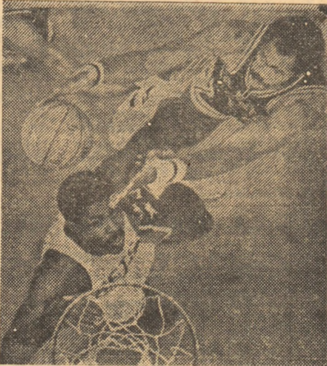
Baschetul înseamnă dinamism, spectacol sportiv, luptă athletică, subtilități tehnice. Un sport cu adevărat la înălțime, așa cum ne ilustrează și această imagine