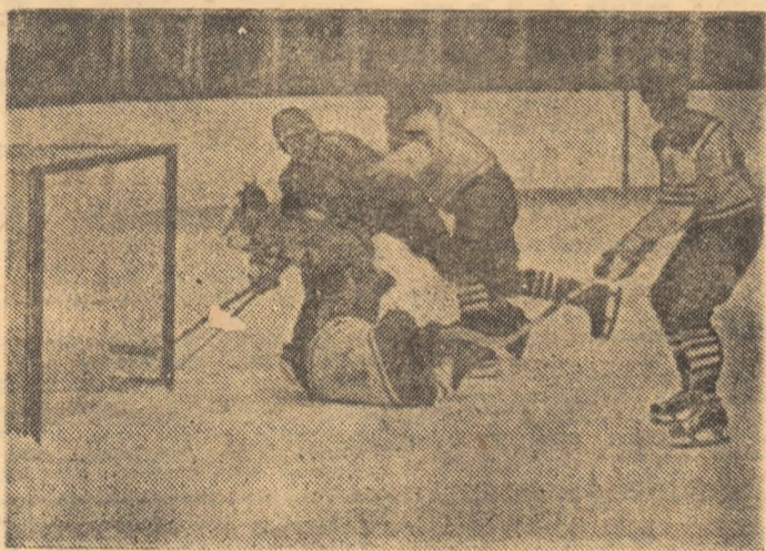
O combinație rapidă a hocheiștilor români în fața porții polneze

După primele partide internaționale ale hocheiștilor