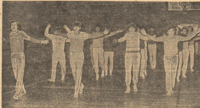
Fotbaliștii Sportului studențesc au avut, în programul de ieri, o sesiune de antrenament în sală, din care fotoreporterul nostru a surprins secvența de mai sus.

Pentru a ajunge la ele, Sportul studențesc a pornit alături de el la drum. Pînă duminică, antrenamente în sală și în aer liber. Apoi, pentru „încălzirea bateriilor” — la Pîrîul Rece.