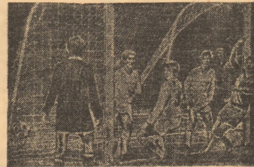
O fază din meciul Zenit Leningrad — Kuusysi Lahti (2-1 în primul joc, dar această fotbalistă finlandeză vor obține calificarea, cu 2-1), în tricouri albe, jucătorii de la Kuusysi.

Ieri, la Zürich, au fost stabilite, prin tragere la sorți, meciurile din sferturile de finală ale cupelor europene. După cum am anunțat, primul tur va avea loc la 5 martie, iar returul la 19 martie. Primele echipe sînt gazde. Iată programul complet al jocurilor.