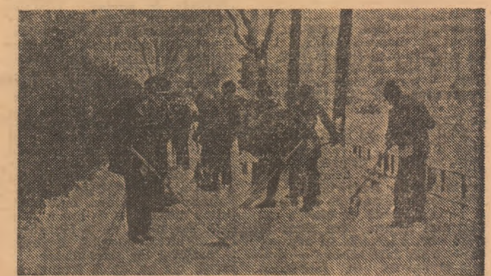
Pe șoseaua Ștefan cel Mare au acționat ieri, la dezăpezire, un mare număr de sportivi dinamoviști

ca, în aceste condiții grele, întreaga activitate economică și socială să se desfășoare normal. Bineînțeles, dintre cei angrenați cu toate forțele lor în această acțiune nu lipsesc sportivii, care, de la mic la mare, se află și ei în primele rînduri, cu hărnicia și entuziasmul care le sînt caracteristice.