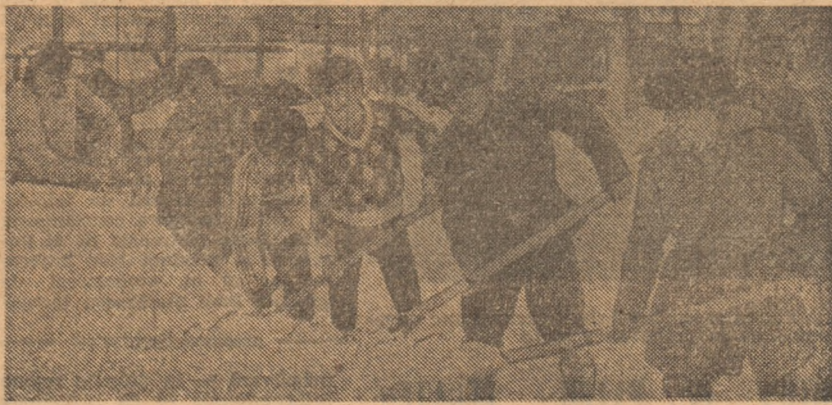
Sportivii de la Steaua, înlăturând zăpada de pe Calea Plevnei

ca, în aceste condiții grele, întreaga activitate economică și socială să se desfășoare normal. Bineînțeles, dintre cei angrenați cu toate forțele lor în această acțiune nu lipsesc sportivii, care, de la mic la mare, se află și ei în primele rînduri, cu hărnicia și entuziasmul care le sînt caracteristice.