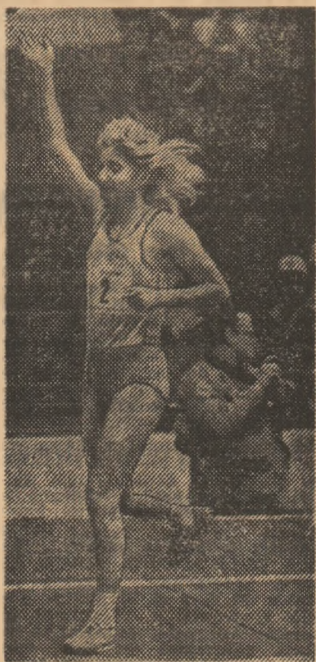
Maricica Puică, după cursa de 1500 m de la Ottawa.

● Două victorii românești în concursul internațional de la Sofia: Mihaela Loghin - 20,40 m la greutate, și Cleopatra Pălăcian - 9:28,43 la 3000 m.