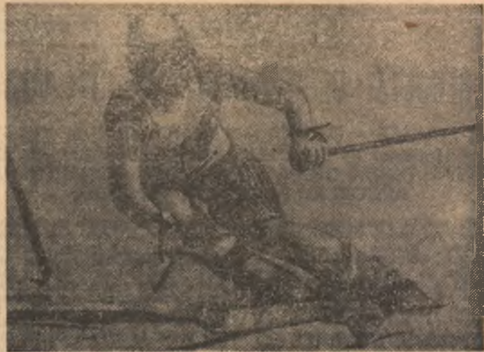
Mateja Svet, încă o vedetă pe care sportul iugoslav o prezintă marelui schi internațional...