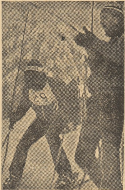
În așteptarea startului în „Cupa U.T.C.”

De remarcat comportarea excelentă a sportivilor din