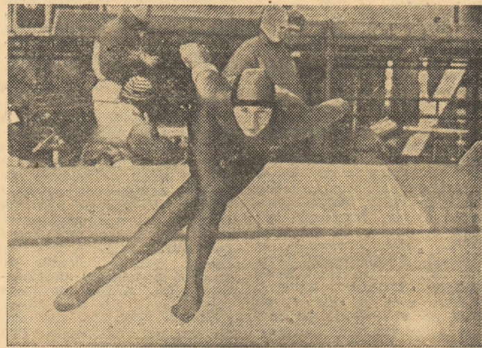
Karin Enke-Kania (R.D.G.), una dintre cele mai mari patinatoare ale lumii, în timpul cursei (câștigată) de 5000 metri din cadrul ultimei ediții a Campionatelor mondiale, de la Haga.

● În cadrul unui concurs desfășurat la Viena, Thomas Schönlebe (R.D.G.) a parcurs 400 m în 45,41 — nou record mondial.