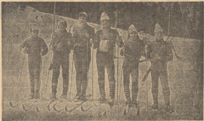
Echipa Școlii generale din Albac, participantă la finala pe țară a Complexului aplicativ P.T.A.P. — Predeal 1985

în calitate de director, în urmă cu câțiva ani, la fabrica de confecții din Cluj — le făcuse echipament de schi tinerilor albăcești, iar de la județ li se trimisese schiuri de performanță.