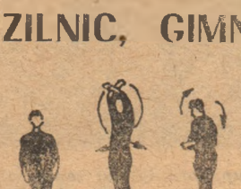
Pi. 1-2 3-4

P.I. — stînd. Balansarea piciorului sting lateral și ridicarea brațelor lateral-orizantal (1-2). Acceași cu piciorul drept (5-8). Ridicările cu inspirație (1-2), coborîrea brațelor și picioarelor-expirație: 3-4 revenire. Se execută de 4-6 ori.