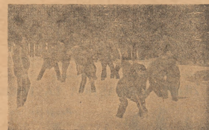
Înainte antrenamentelor din sală, luptătorii lotului reprezentativ se „încălesc" pe... zăpadă

Așadar, „povestea" cu renunțarea la mulți luptători, mai