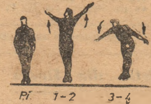
Pi. 1-2 3-4

Acceași spre dreapta. Execuție lentă de 4 ori.