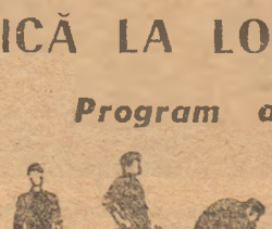
Pi. 4 1 2-3

P.I. — stînd. Rotarea brațelor prin legănarea lor în față, cu ridicare pe virfuri și inspirație, iar la coborîrea brațelor-expirație. Execuție lentă de 6 ori.