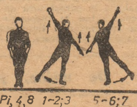
Pi. 4, 8 1-2; 3 5-6; 7

Poziția inițială — stînd. Ridicarea pe virfuri cu brațele lateral, cu palmele răsucite în sus — inspirație (se arcuiește trunchiul înapoi). Revenire pe talpă și călcii cu răsucirea palmelor în jos — expirație (cu înclinarea trunchiului înainte). Se execută de 6 ori.