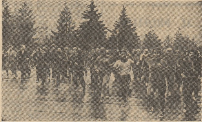
Crosul Tineretului. Aspect din etapa pe Sectorul 2, la care au luat parte peste 2500 de concurenți.

punerii în viață a obiectivelor cuprinse în planul de dezvoltare pe anul 1985, punând accentul principal pe organizarea și cuprinderea întregului tineret, a oamenilor muncii în întrecerile „Daciadei“. Ceea ce s-a realizat în răstimp de un an a fost urmare a unor eficiente măsuri organizatorice din care amintim câteva: înființarea a