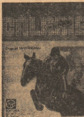
grafi (majoritatea nepublicate pînă acum) — îndeamnă, prin calitățile ei, la lectură și, deopotrivă, la prezența ca spectator — și de ce nu! — chiar ca participant la mereu spectaculoasele întreceri de călărie...

Apariția curentelor, a școlilor de echitație, perfecționarea disciplinelor specifice — dresajul, obstacolele și concursul complet, ca și apariția marilor competiții hipice internaționale etc. — alte pagini care-l conduc pe cititor spre mini-dictionarul echitației (o severă probă de rigoare documentară trecută cu succes de autor) și, în final, spre bogatul capitol statistic în care sînt, desigur, cuprinse și participările internaționale ale călăreților români de la începutul acestui secol și pînă astăzi. Lucrarea, cuprinzînd numeroase ilustrații-desene (autor: arh. Mihaela Fântăneanu) și foto-