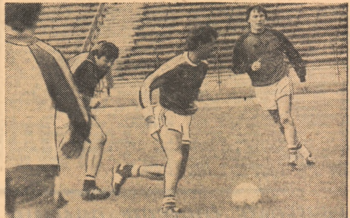
Moment din antrenamentul de ieri al fotbalistilor sovietici. Primul din dreapta, cunoscutul internațional Blohin.