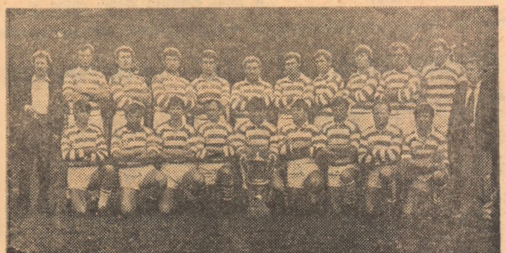
Rugbyștii bîrlădeni și prețiosul lor trofeu, cîștigat ieri în finală de la București.

Al doilea act important al rugbyului autohton — Cupa României — și-a consumat, ieri dimineață, pe Stadionul Tinerețului din Capitală, ultima fază. Și, chiar dacă în teren nu au fost cele mai bune echipe românești ale momentului, putem afirma, fără teama de a fi contrazis, că Rulmentul Bîrlad și Știința CEMIN Baia Mare au onorat finala, angajându-se din primul și pînă în ultimul minut într-o dispută pe cîț de acerbă, pe alit de pasionantă. Au cîștigat rugbyștii de la Rulmentul cu 6-3 (3-0), deoarece inițiativa le-a aparținut în majoritatea timpului de joc, ei pîrînd mult mai decisi, mult mai inspirați decât partenerii din Baia Mare. Din mină, risipa de energie, dar