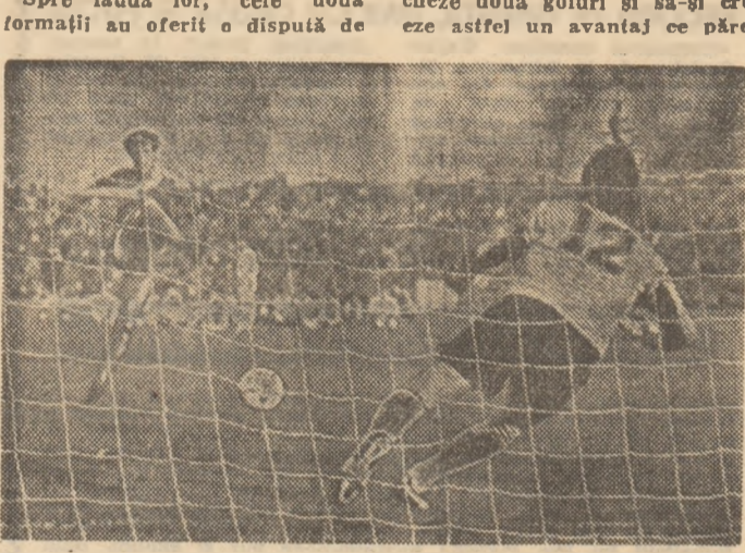
Moraru apără lovitura de la 11 metri executată de Cămătaru, înclinând astfel balanța victoriei în favoarea echipei dinamoviștilor

decisiv pentru victorie. Dar dinamoviștii nu s-au lăsat de loc copleșiți de această turnură nefavorabilă pentru ei.