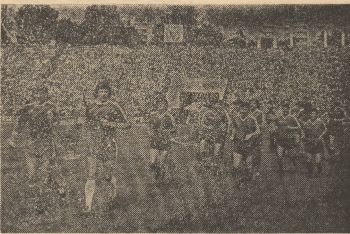
Sub puternicele aplauze ale celor 70.000 de spectatori, jucătorii echipei Steaua au luat startul în „Turul de onoare”

La prima apariţie oficială a echipei noastre campioane după răsunătoarea performanţă a cuceririi Cupei Campionilor Europeni, ieri, pe stadionul „23 August” din Capitală, în prezenţa a peste 70.000 de spectatori, s-a desfăşurat ultimul meci din sferturile de finală ale Cupei României, între Steaua şi Progresul-Vulcan. Un meci aşteptat cu justificat interes, în primul rînd pentru a-l revedea pe... viu pe „eroii” de la Sevilla. Chiar dacă partida nu a atins cote valorice deosebite, ea a plăcut totuşi prin sîmănta acţiunilor de poartă, ca şi prin numărul de goluri marcate, în final Steaua obţinînd o victorie lejeră, cu 5-1 (3-0), graţie că-