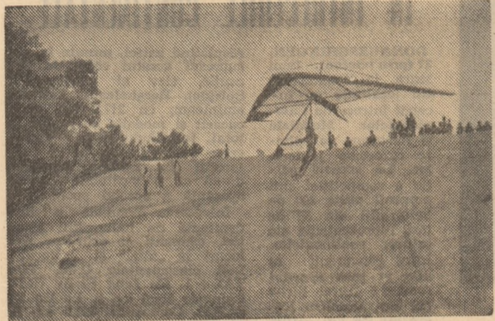
Cițiva pași și curenții aerodinamici de pantă îl înalță pe concurent.