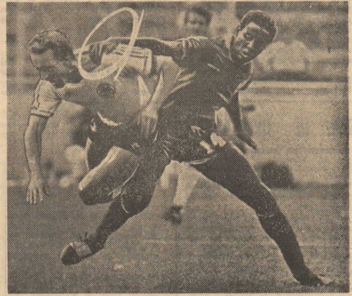
O imagine a unui fault, așa-zis „bînd”, din timpul Mondialului '86, asupra lui K.H. Rummenigge.

lonul rotund. Nici nu se împlinise încă un minut de joc (trecuseră abia 53 de secunde) și tînărul arbitru francez Joel Quiniou i-a arătat cartonașul roșu lui Batista, eliminînd-l pentru un fault grosolan comis asupra unui scottian.