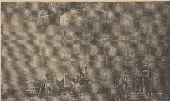
Ultima încordare deasupra punctului fix

„Internaționalele” de parașutism ale României, disputate săptămîna trecută pe aerodromul sportiv Brașov-Ghimbav, pot fi considerate drept ediția cu cel mai ridicat nivel valoric, după cum o atestă rezultatele primilor clasai. Reprezentanții a două puternice școli de parașutism, sportivii din Bulgaria și R.D. Germană, și-au disputat înțietatea în toate probele, confirmînd și cu acest prilej, prin performanțele realizate, atît succesele de pînă acum, cît și perspectivele în vederea C.M. — 1988. Astfel, proba de punct fix a fost cîștigată de Diana Wiedmann (R.D.G.) cu un total de 0,02 m (8 salturi, dintre care 8 de 0,09 m) și, respectiv, Ivan Păcirov (Bulgaria) cu 0,04 m (din cele 8 aterizări, 5 de 0,09 m). Proba de acrobație a revenit Katje Schneider (R.D.G.) 26,19 s (media pentru cele trei lansări fiind sub 9 s) și Dragomir Nedcov (Bulgaria) 23,46 s (media sub