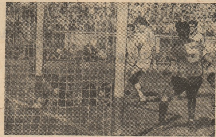
Pișcă într-o spectaculoasă acțiune la poarta lui Moraru. Secvență din ultima întâlnire (din campionat) Steua - Dinamo.