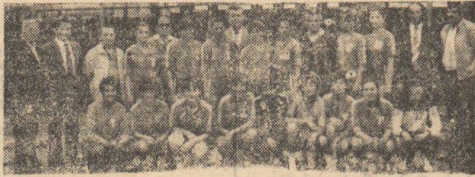
Lotul echipei Constructorul Baia Mare