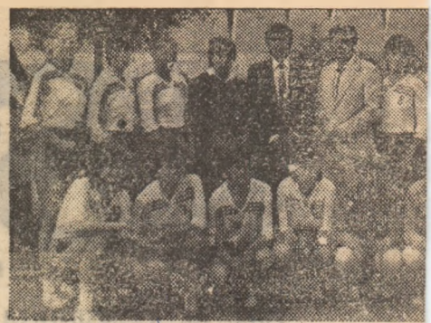
Lotul echipei C.S.M. Sf. Gheorghe