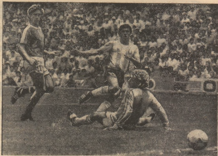
Jorge Alberto Valdano înscrie golul al doilea al formației Argentinei în partida finală, cu R.F. Germană