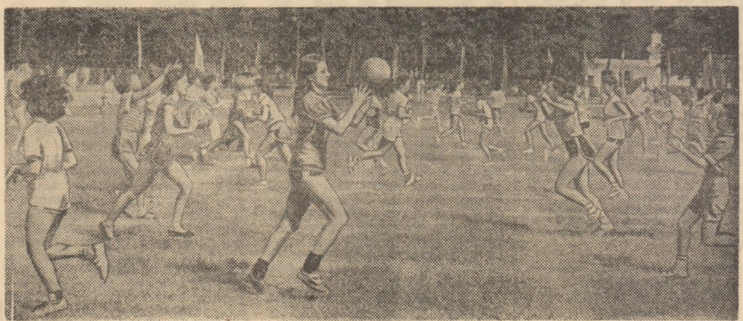
A început vacanța! Pretutindeni elevii, într-o binemeritată relaxare, au invadat terenurile de sport. (Imagine, surprinsă de fotoreporterul nostru Iorgu Bănică, pe Stadionul Tineretului din Capitală)

întîlni formații sindicale remarcate în actualul sezon competițional. Vor participa C. P. București, deținătoarea „Cupei României”, Metalul Tirgoviște, Electro Botoșani, Laminorul Beclean, Automatica Alexandria, I.P.L. Blaj și alte echipe de valoare.