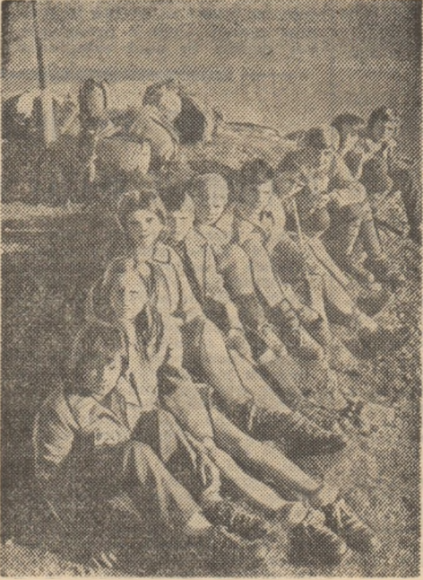
Mindria tinerilor turiști: o fotografie-amințire de pe virful Moldoveanu

te în care, am putea spune, cu greu ar putea fi egalăți. Întrebările veneau firește, una după alta: „Bine, dar cine le inoculează această pasiune?”, „Cum se explică faptul că vârsta celor ce iubesc turismul