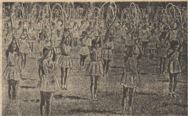
Dacia continuă să-și dezvăluie frumusețea și în aceste zile ale vacanței de vară, reunind pe terenuri zeci de mii de tineri și tinere din întreaga țară.