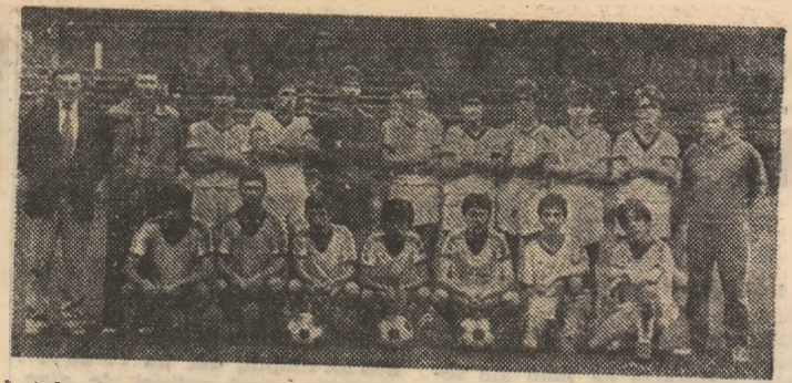
Lotul echipei Unirea Dinamo Focșani