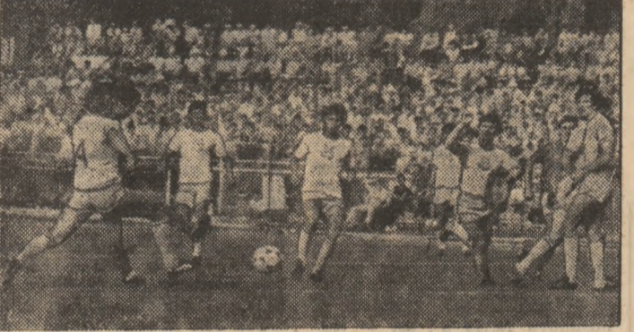
Dezensiva echipei F.C. Olt (în tricouri albe) încearcă să stopeze un atac al dinamoviștilor bucureșteni

bătînd la ușă. Și astfel a început turul de forță al „supraviețuirii” în A. Jucătorii au început să-și recapete încrederea în forțele proprii și s-au pus pe treabă. Mihali și Mînea au devenit piese de bază în apărare, Crișan, revitalizez, a tras realmente întreaga echipă după el, echipa i s-a subordonat și, astfel, în ultimele șase etape F. C. Olt nu a mai cu-