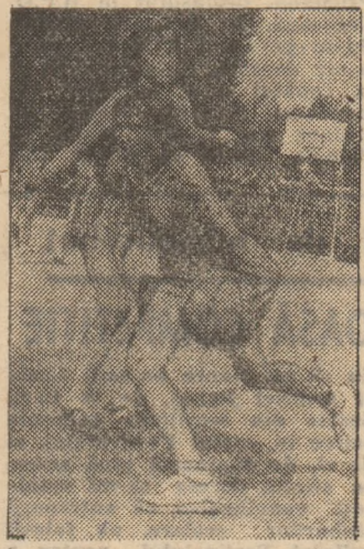
Patrundere impetuoasă, dribling cu mîna stîngă, lată o spectaculoasă acțiune intraprinșă de una din participantele la Festival