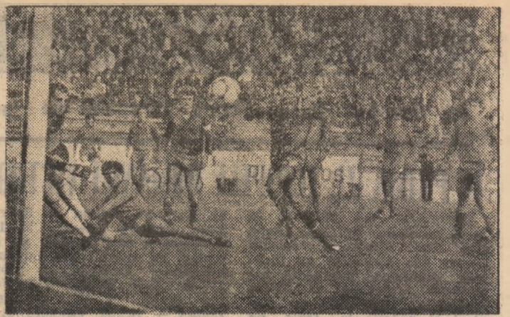
Din nou emoții la poarta vilceană în meciul de la București, cu Steaua