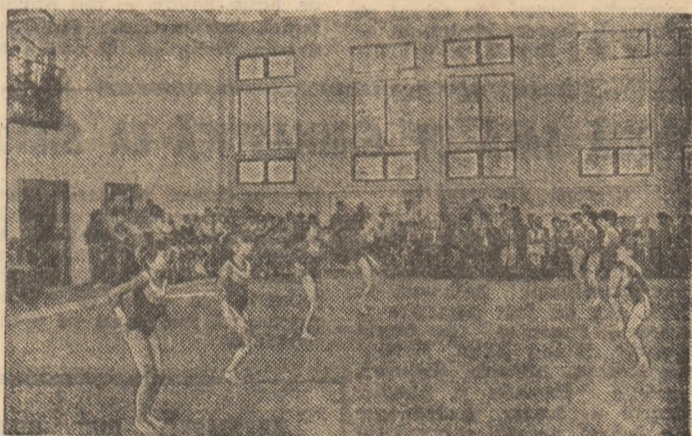
Un aspect de la inaugurarea sălii

De puțină vreme, baza materială a mișcării noastre sportive s-a îmbogățit cu un nou și modern edificiu, pus în slujba desăvîrșirii măiestriei, a ridicării pe noi trepte a performanței sportive: la Sibiu, prin grija organelor locale de partid și de stat, cu sprijinul C.N.E.F.S. și al forurilor sportive județene, a fost dată în folosință noua sală de gimnastică.