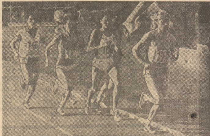
Maricica Puică în fruntea grupului de alergătoare într-o cursă de 1500 m.

...nou, pentru care fiecare s-a antrenat ore și zile întregi. Dar campionatele de la Pitești, așa cum am mai arătat, constituie un foarte bun prilej de selecție a celor mai merituoși dintre atleți pentru Campionatele Europene de la Stuttgart, înțelegînd că cel care vor fi în formă acum, se presupune că vor fi și spre