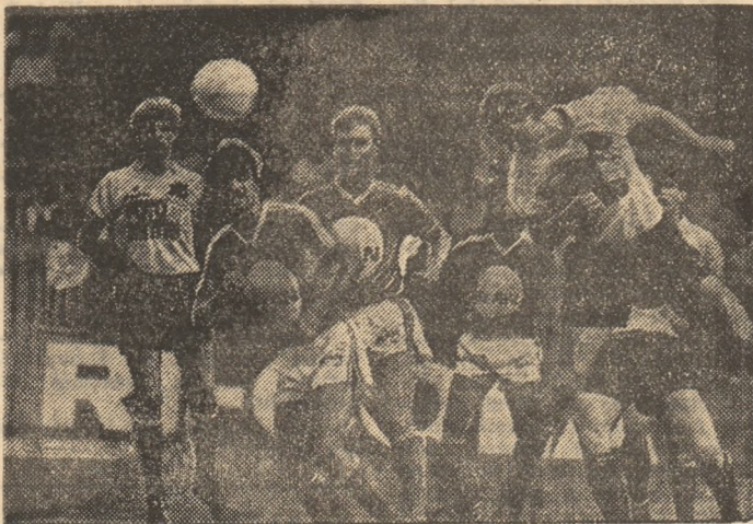
Aspect dintr-un meci din noua ediție a campionatului austriac (Rapid — Vienna).

În finala turneului internațional de la Verbier (Elveția) jucătorul suedez Joakim Nyström a dispus cu 7-5, 6-3, 7-5 de francezul Henri Leconte ● Turneul internațional de la Washington a fost cîștigat de tînarul jucător cehoslovac Karel Novacek, care l-a învins în finală cu 6-1, 7-6 pe francezul Thierry Tulasne, cîștigînd printre favoriții concursului.