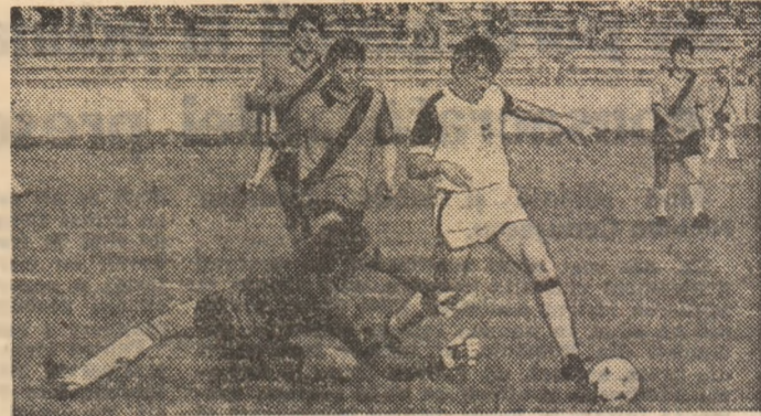
Asemenea lui Hagi (tricou de culoare deschisă) - surprins de obiectivul fotografic în plină „șarjă” spre poarta adversă - așteptăm un campionat cu mult spirit ofensiv, cu cifre de valoare la capitalul eficientat.

● Marele obiectiv al noii ediții: creșterea valorică, prin contribuția TUTUROR concurenților ● Spectatorii și îndreptățita lor dorință ● Aportul factorilor direct implicați, o condiție a reușitei campionatului