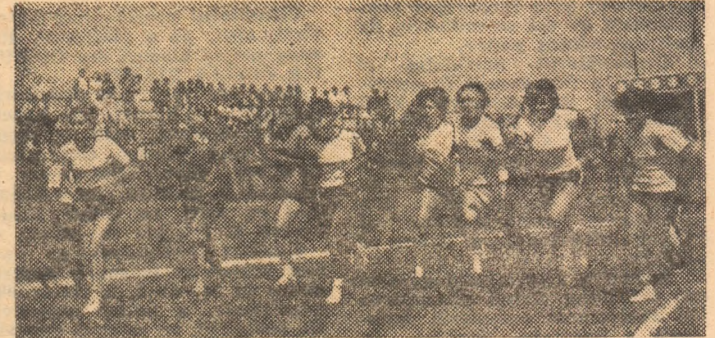
În plină cursă, participantele în proba de 800 m.

loc, în și Zidii alte rec pline coș bal, vo ce și și și di județul ceastă „Cupel centre nicit sportiv: perman nău, Săhăteț etc); și și orga miteful educației Comite spectator, ganele stat di cut de cestei cadru disponi care și cultivate să-l tr popula