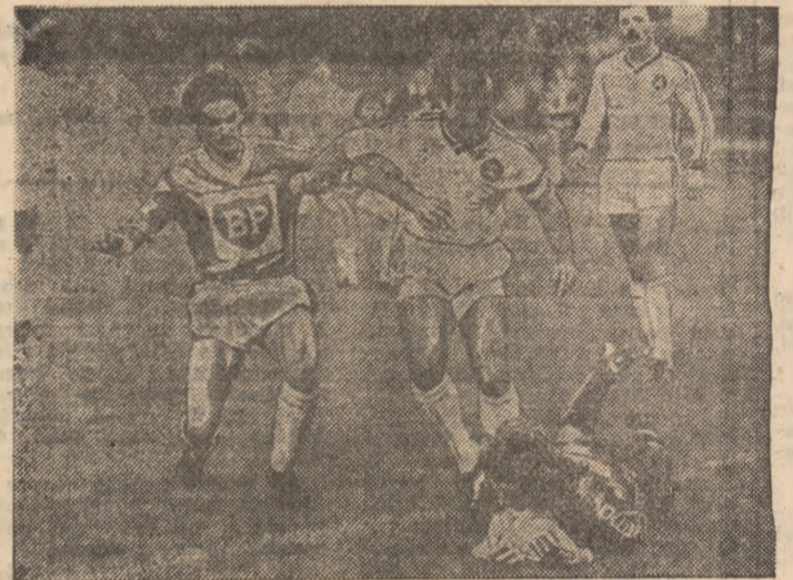
O fază din meciul Austria Klagenfurt — Wiener Sportclub (2-2): jucătorii vienezi (în echipament alb) „blocați” de portarul gazdelor.

Skopje — Steaua Roșie Belgrad 1-0, Dinamo Vinkovici — Rijeka 1-1, Partizan Belgrad — Celic Zenita 2-1, Sarajevo — Dinamo Zagreb 1-1, Velez Mostar — Zeleznicar Sarajevo 4-2, Hajduk Split — Osijek 2-0, Niš — Pristina 2-0, Titograd — Tuzla 2-1. Pe primele locuri: Skopje 6 p, Niš, Hajduk Split cu câte 5 p.