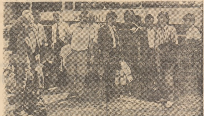
Jucătorii din echipa Austriei surprinși la puține momente după sositrea în Capitală.

Ieri la amiază, la bordul unui avion special, a sosit în Capitală lotul reprezentativ de fotbal al Austriei. În fruntea delegației, Helmuth Ragautz, vicepreședintele forului de specialitate din Viena. Oaspeții au fost întâmpinați la aeroportul Otopeni de reprezentanți ai federației noastre. Grupul sportivilor austrieci este însoțit de comentatori de radio, televi-