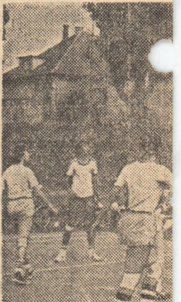
O imagine din cursul — C.S.S.

Turneele finale ale Concursului Republican — Criteriul Speranțelor al baschetbaliștilor juniori III, desfășurate pe terenurile Liceului „Ion Slavici” și A.S. Constructorul din Arad, au întrunit peste 150 de elevi și elevițe. Disputate în prezența unui mare număr de spectatori și într-o atmosferă specifică întrecerilor tineresti, competiția s-a încheiat cu succesul echipei C.S.S. Arad. În finala băleților, baschetbaliștii arădeni au învins cu 63-45 formația C.S.S. I Constanța, iar în finala fetelor gazdele au câștigat cu 65-50 în fața echipei C.S.S. 4 București.