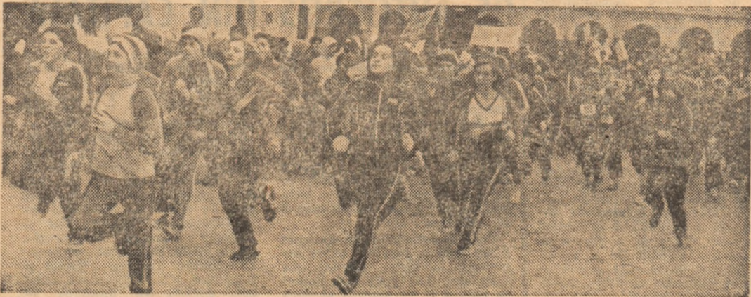
În marea arenă a Daciadei, crosurile de masă reprezintă o constantă la nivelul tuturor asociațiilor sportive

Desfășurată în intervalul aprilie-octombrie 1986, etapa de vară a celei de-a V-a ediții a Daciadei a avut ca principală direcție îndeplinirea obiectivului stabilit de Congresul al XIII-lea al partidului vizând acordarea unei atenții deosebite organizării și desfășurării marii competiții sportive naționale, realizării sarcinilor izvorite din Programul de dezvoltare a activității de educație