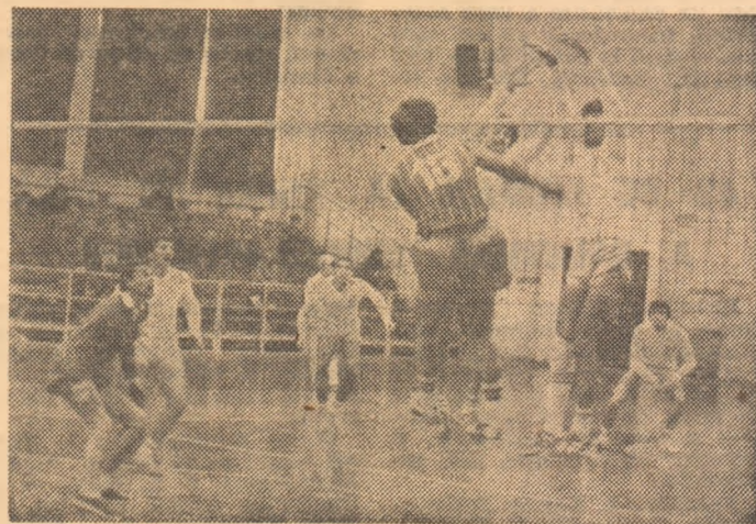
Fază dintr-unul din meciurile disputate în Capitală: C.S.M.U. Suceava - „Pol” Timișoara 3-2