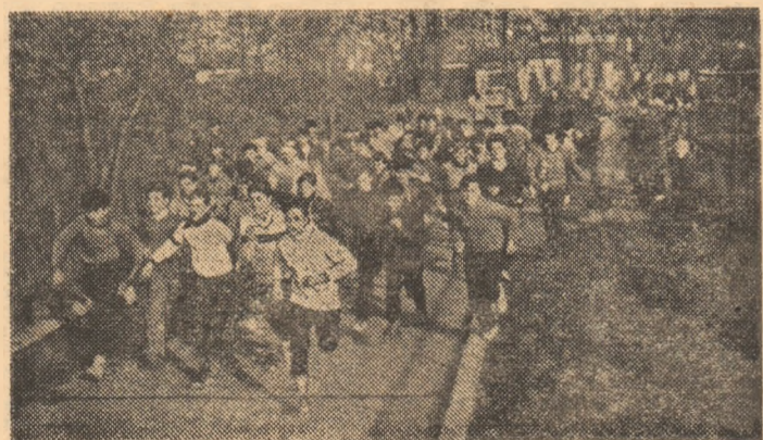
Întreceri animate la „Crosul de toamnă” desfășurat pe stadionul Voiața din Capitală.

Întrecerile au evidențiat buna pregătire a sportivilor, majoritatea competitorilor participînd, mai în fiecare săptămînă, la alergările în aer liber