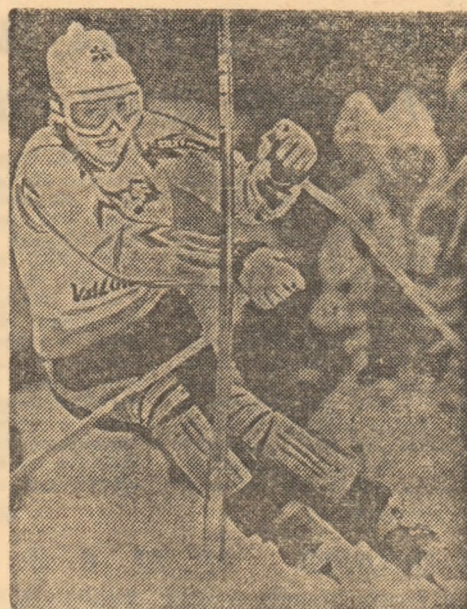
Erika Hess și-a făcut o reintrare spectaculoasă, câștigând slalomul pe pirtia de la Val Zoldana.

● Biatloniștii sovietici au câștigat proba de stafetă desfășurată în localitatea Oberauer din Austria. Echipa alcătuită din Vasiliyev, Popov, Medvedev și Zenkov a parcurs traseul în 1:50:49,00 cu 0 ture de penalizare. Pe locurile următoare s-au clasat R.D.G. I 1:51:24,1 (1) și Norvegia 1:51:41,4 (3) etc. ● Echipa Suediei I a terminat învingătoare proba de stafetă 4x10 km în concursul de fond (de stil liber) de la Davos. Rezultate: 1. Suedia I 1:58:54,06. 2. Finlanda I 1:59:02,00. 3. U.R.S.S. II 1:59:05,09 etc. ● La Coigne, în Italia, cursa de 4x5 km din cadrul Cupei Mondiale feminine a prilejuit victoria formației Norvegiei în 1:00:46. S-au clasat, în continuare: 2. Cehoslovacia