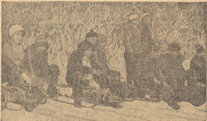
Iarnă, cu multă zăpadă, a poposit și în Capitală, spre bucuria copiilor care au asaltat derdelușurile cu săniile lor „zburătoare”