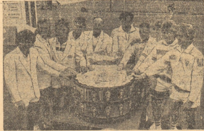
Echipele Australiei și Suediei „pozează” tradițional cu jaimoasa salată de argint — „Cupa Davis”

Pat Cash, care, după ce dispusese. În prima zi, de Stefan Edberg, al 5-lea tenisman din lume, a avut o contribuție de seamă în